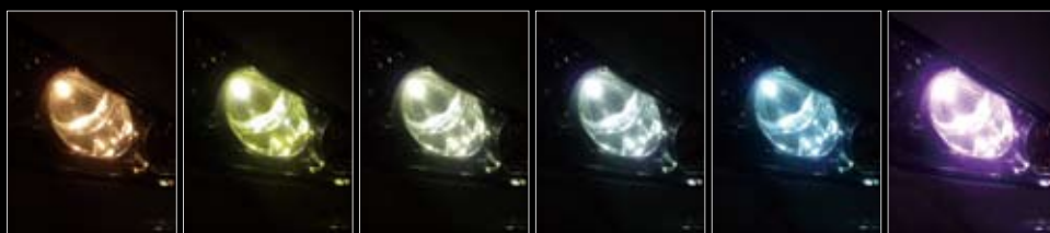
ハロゲンバルブ 3000k 4500k 6000k 8000k 12000k