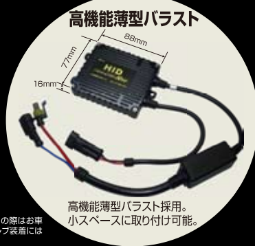
高機能薄型バラスト採用。小スペースに取り付け可能。